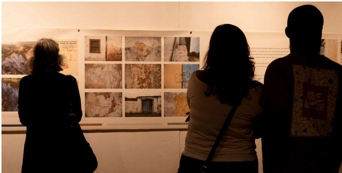
Exposição Cores e Técnicas Autoria: Lucas Godoy Data: 12/11/2024