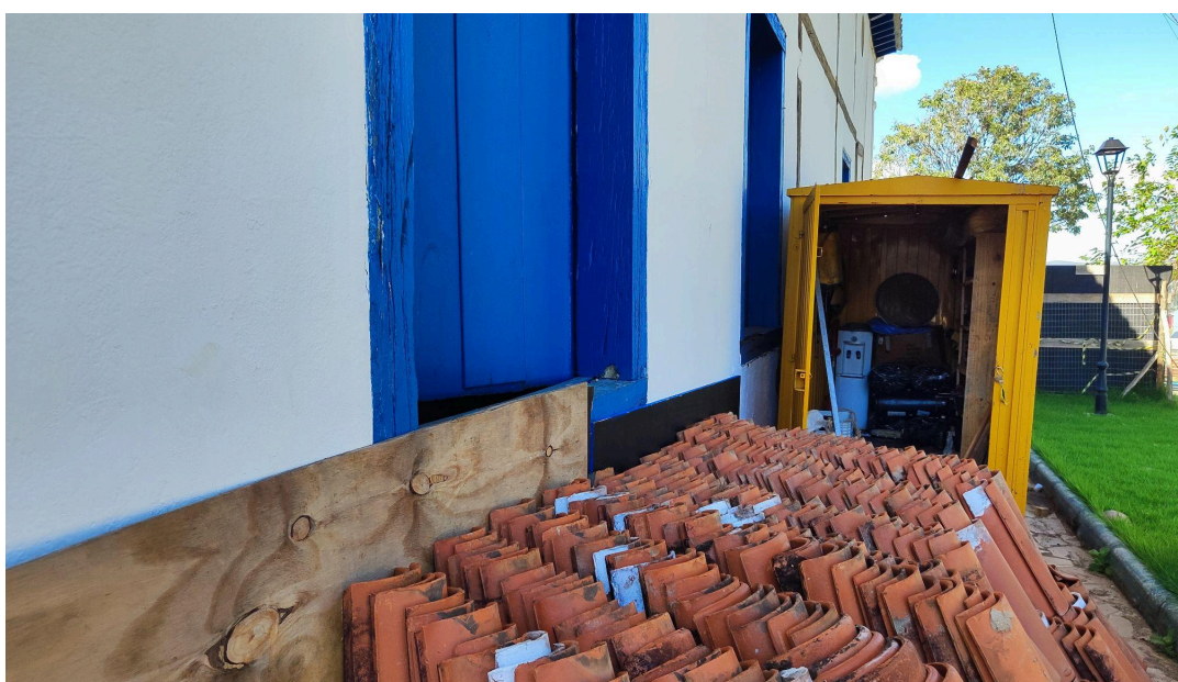
Canteiro de obras mobilizado - container e material Data: 06/05/2026