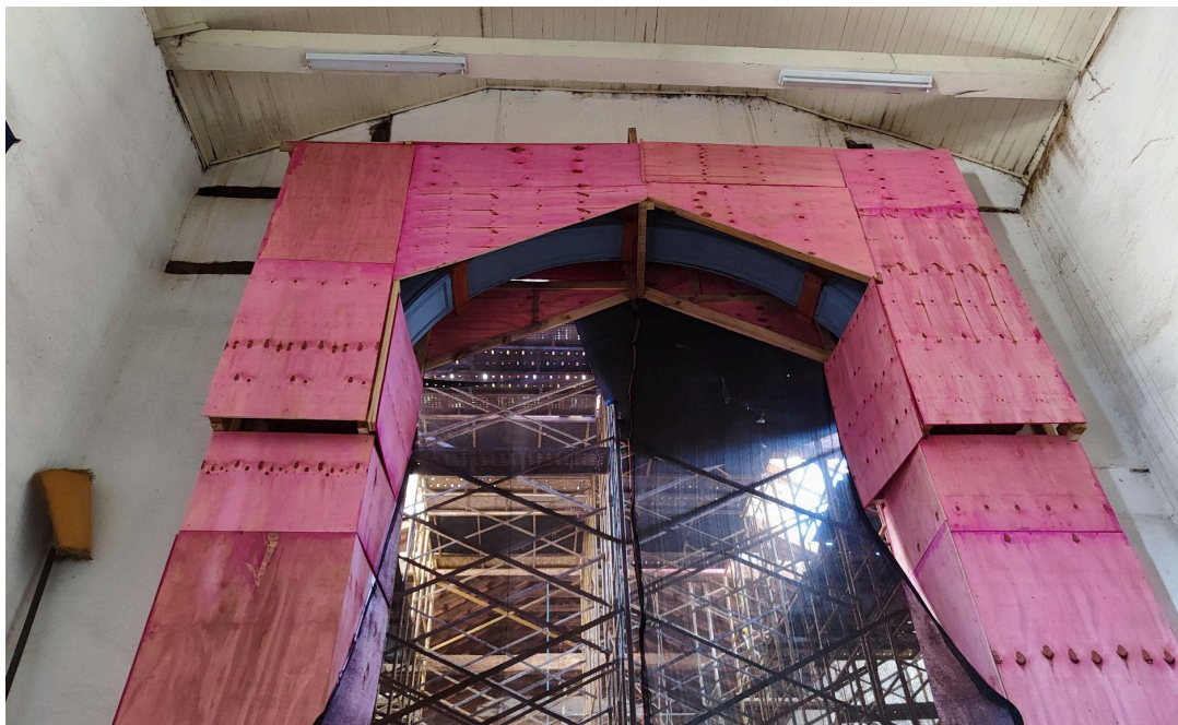
Proteção do arco-cruzeiro Autoria: Francielle Ferreira Data: 06/05/2026