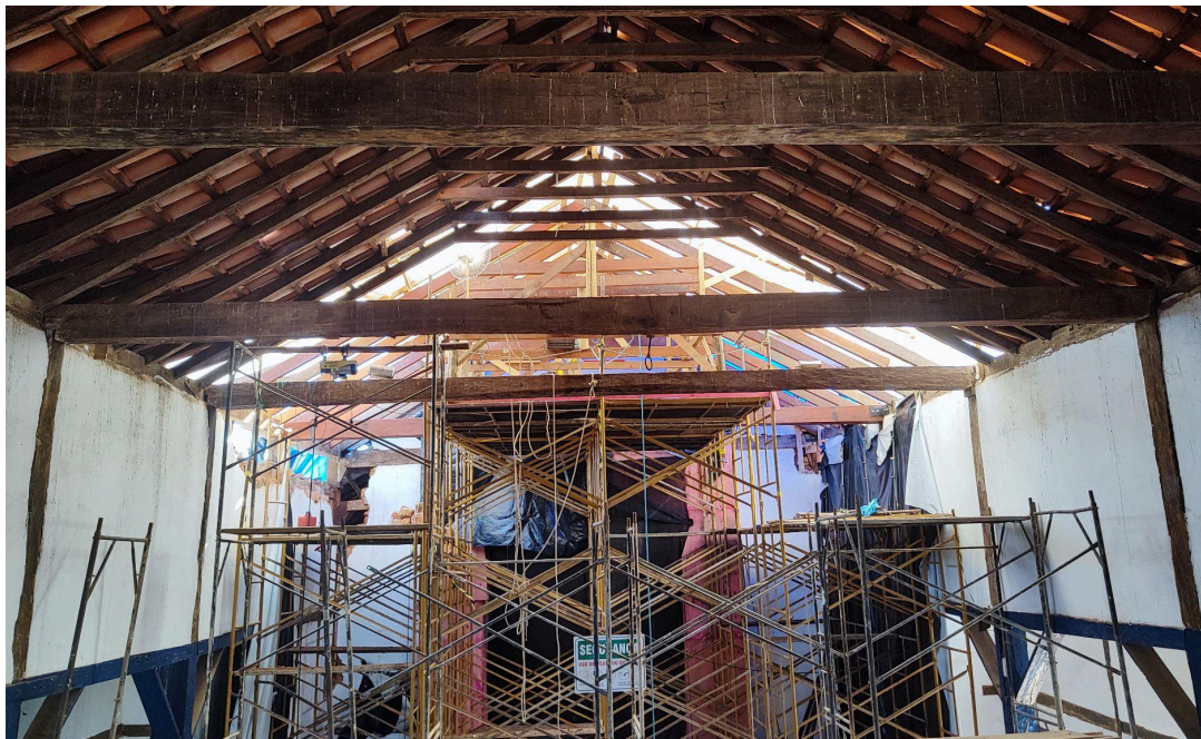
Execução dos reparos emergenciais da cobertura da nave Data: 06/05/2026