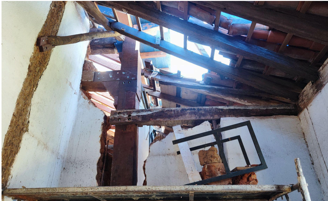
Ligação das peças estruturais da madre e esteio no encontro da parede lateral da nave (lado do Evangelho) com Transepto Data: 06/05/2026