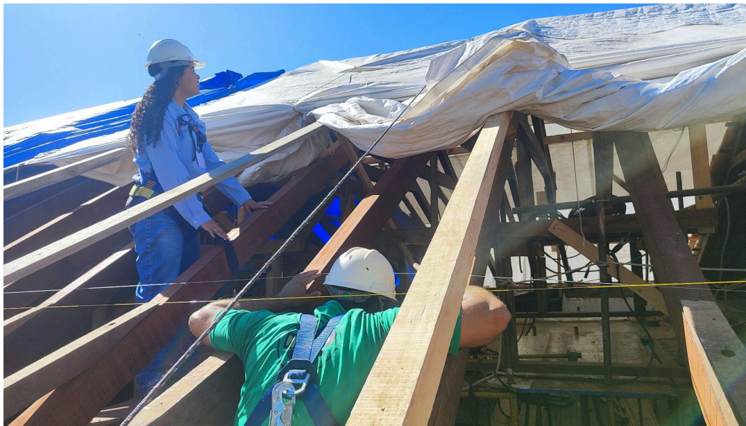
Verificação do andamento da execução dos serviços na cobertura da nave Autoria: Francielle Ferreira Data: 06/05/2026

Por fim, constatamos que o projeto está em andamento e recebido pelos participantes. Foi informado ao proponente que quaisquer alterações no projeto deverão ser enviadas formalmente via ofício e que caso haja eventos atinentes ao projeto, as datas deverão ser alinhadas com o Ministério Público e Plataforma Semente.