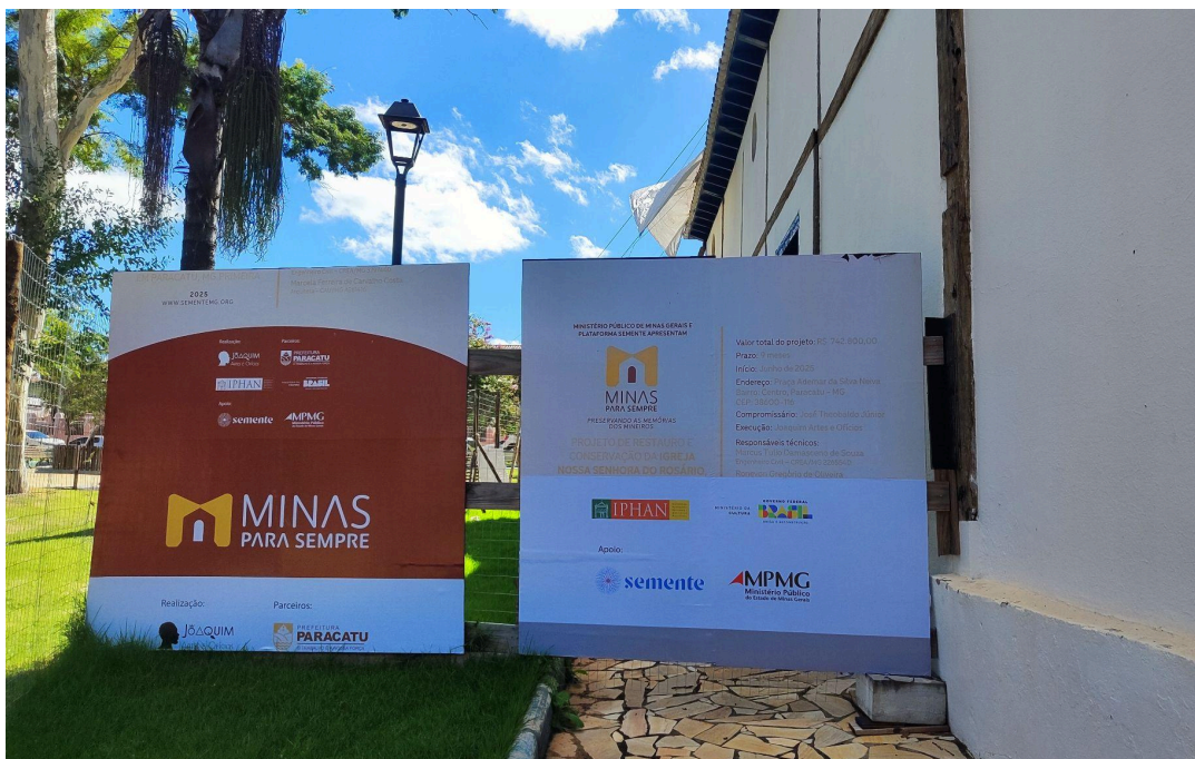
Canteiro de obras mobilizado - cercamento e instalação das placas de obra Autoria: Francielle Ferreira Data: 06/05/2026