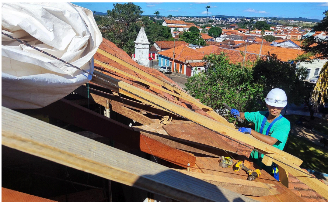
Reparo nas peças estruturais comprometidas da cobertura da nave Data: 06/05/2026