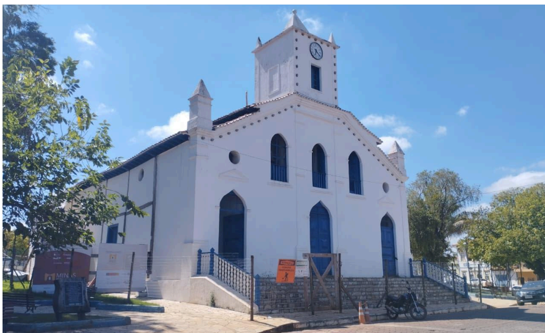
Igreja Nossa Senhora do Rosário, em Paracatu/MG. Data: 06/05/2026