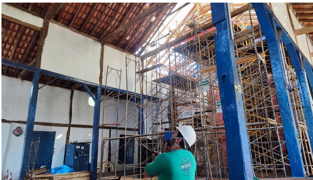
Execução dos reparos emergenciais da cobertura da nave Autoria: Francielle Ferreira Data: 06/05/2026

Escoramento Emergencial da Nave : Após as tratativas da celebração do Termo Aditivo do projeto, o proponente iniciou o desenvolvimento dos projetos emergenciais destinados ao escoramento da cobertura da nave da Igreja Nossa Senhora do Rosário. O projeto de montagem dos andaimes foi elaborado, com o conceito de torres de andaime contraventadas por meio de tesouras estruturais e estabilizadas com amarração estrutural dos elementos.