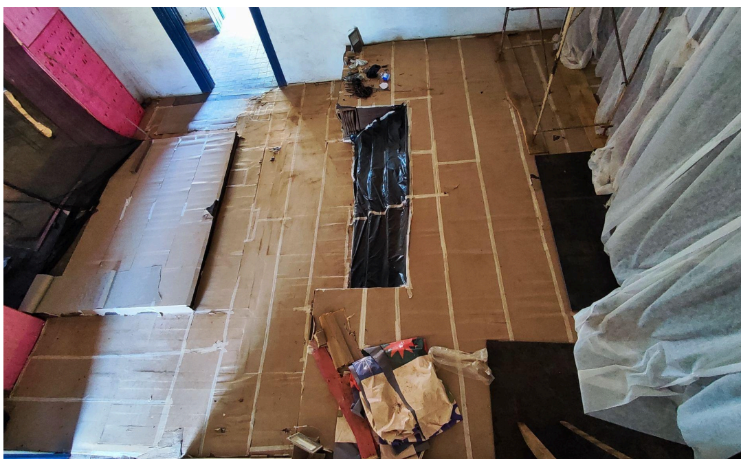
Proteção do piso da capela-mor, arco-cruzeiro (a esquerda) e do altar-mor (a direita) Autoria: Francielle Ferreira Data: 06/05/2026