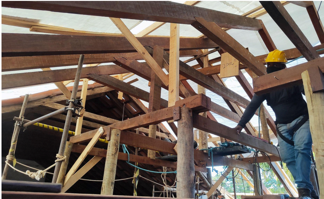
Reparo nas peças estruturais comprometidas da cobertura da nave Autoria: Francielle Ferreira Data: 06/05/2026