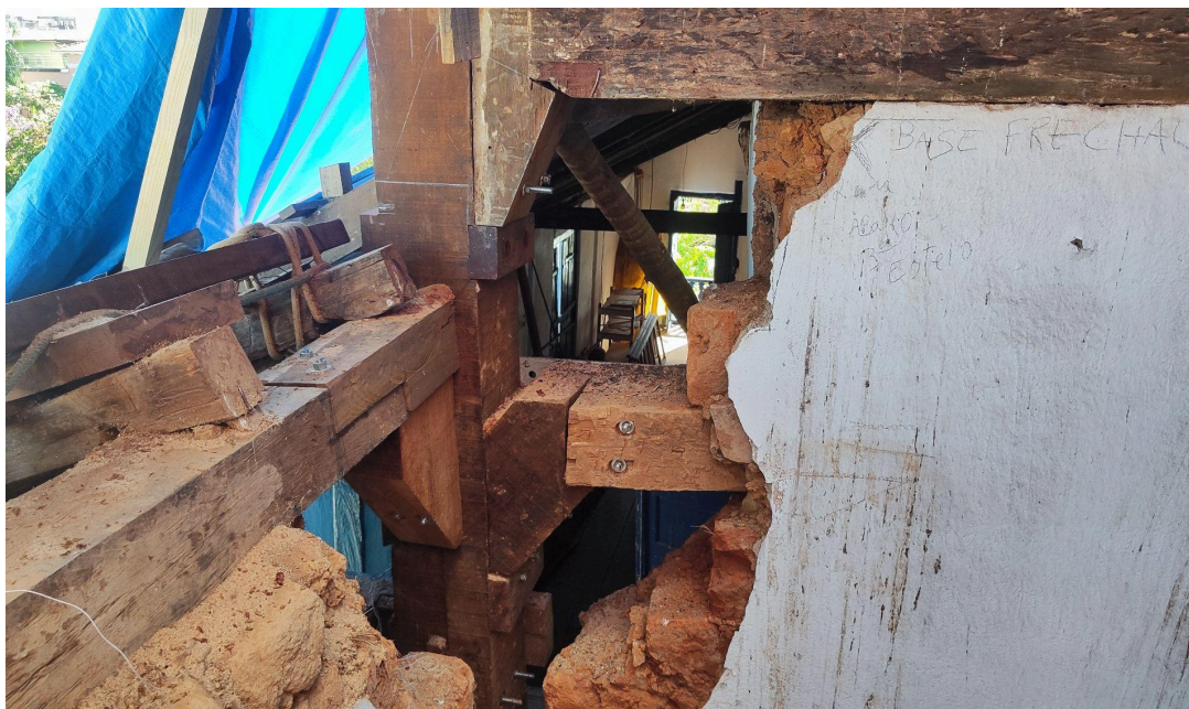
Substituição de todos os elementos estruturais comprometidos Autoria: Francielle Ferreira Data: 06/05/2026