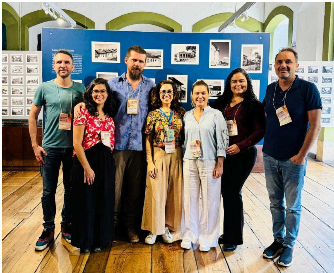
Representantes do Instituto Avaliação, A Pique e Plataforma Semente. Data: 04/12/2024

Ao final da visita, constatamos que as atividades previstas no projeto foram realizadas e satisfatoriamente recebidas pelos participantes.