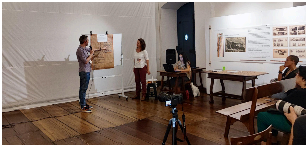
Apresentação das instituições envolvidas nos projetos

os professores consultores apresentaram sobre temas relacionados aos projetos e teceram contribuições.