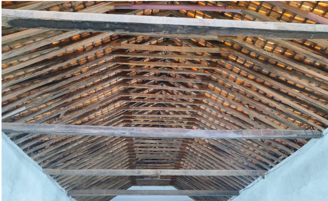
Reforço estrutural executado na cobertura da nave Data: 06/05/2026