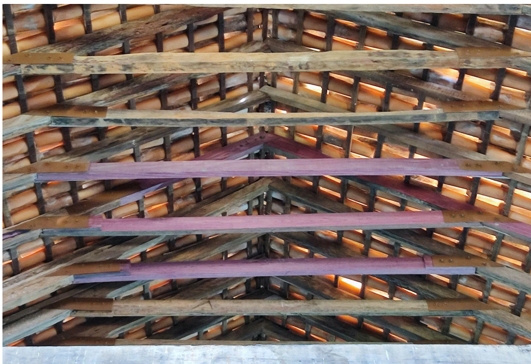
Reforço estrutural executado na cobertura da nave Data: 06/05/2026