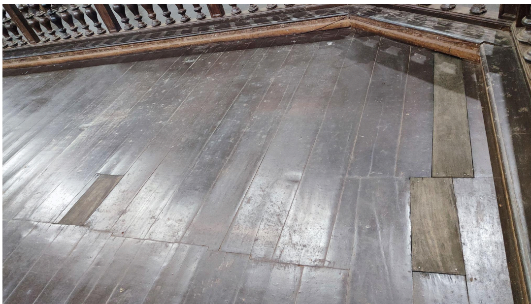
Reparos pontuais no piso da nave - nos elementos visualmente destacados Autoria: Francielle Ferreira Data: 06/05/2026