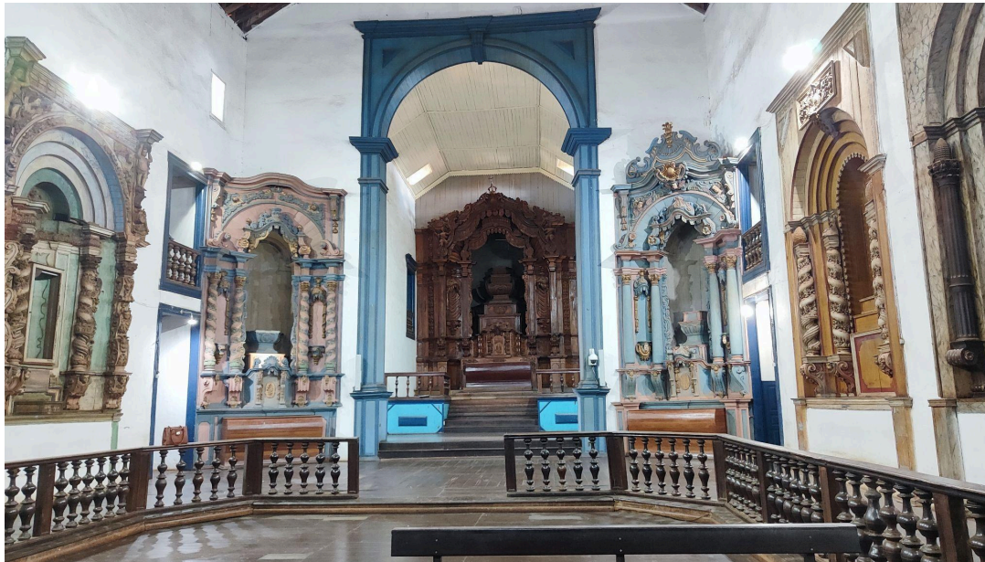
Reparos pontuais no piso da nave - nos elementos visualmente destacados Autoria: Francielle Ferreira Data: 06/05/2026