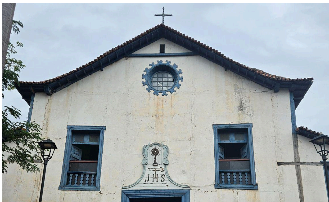
Igreja de Santo Antônio, em Paracatu/MG. Data: 06/05/2026