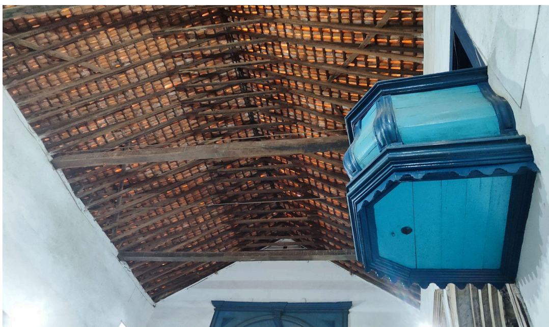
Reforço estrutural executado na cobertura da nave Autoria: Francielle Ferreira Data: 06/05/2026