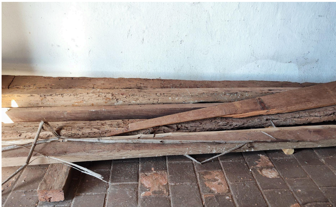
Madeiramento degradado retirado do telhado da nave e substituído Data: 06/05/2026