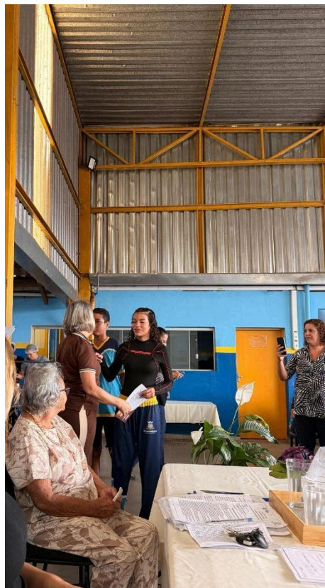
Alunos com os livros do projeto Autoria: Paula Grandi Data: 27/02/2026

O Projeto “Nossa Terra” encontra-se em desenvolvimento conforme o planejamento apresentado pela equipe executora, demonstrando avanço satisfatório das atividades propostas.