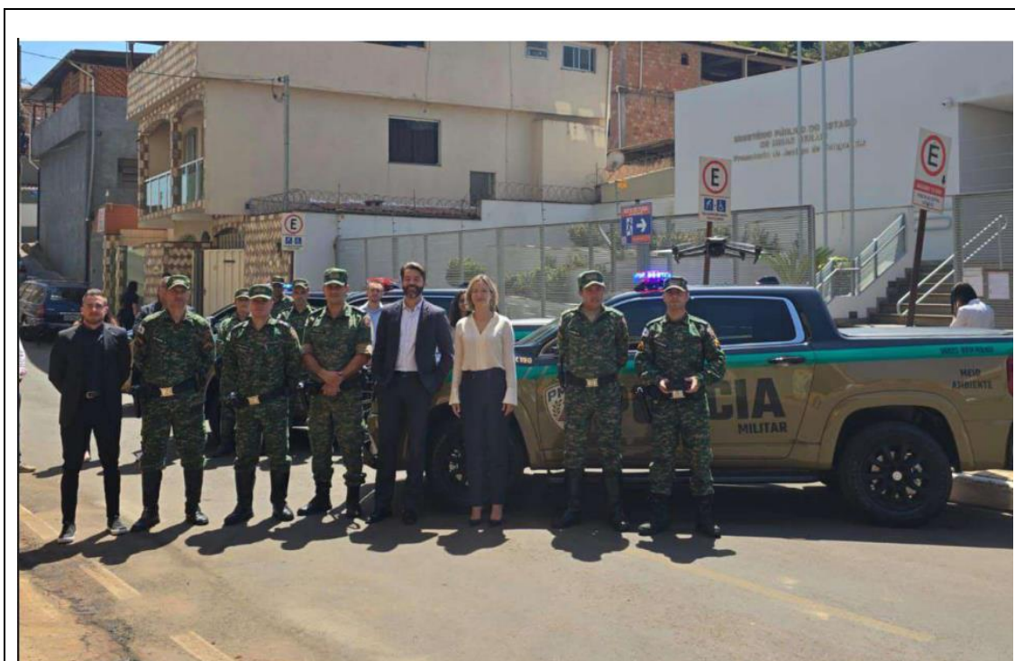
Figura 2 – Entrega das viaturas na solenidade