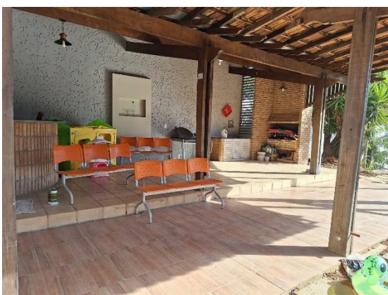
Espaço onde são ministradas as oficinas MASDHE do projeto. Data: 25/06/2024

Na reunião, foram apresentadas as ações iniciais executadas no âmbito do projeto. Todas as acolhidas da Casa estão participando das oficinas iniciais, promovidas pela tecnologia social MASDHE (Marco Sequencial de Desenvolvimento Humano e Empreendedor). Atualmente, estão sendo abordadas temáticas voltadas para o autoconhecimento nas oficinas de ascendência/ponto zero e elaboração dos planos de metas pessoais.