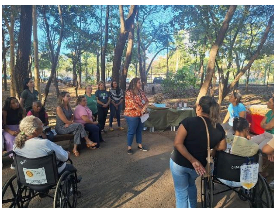
Oficina de papel semente e frutos do cerrado. Autoria: Luísa Mosqueira Data: 25/06/2024