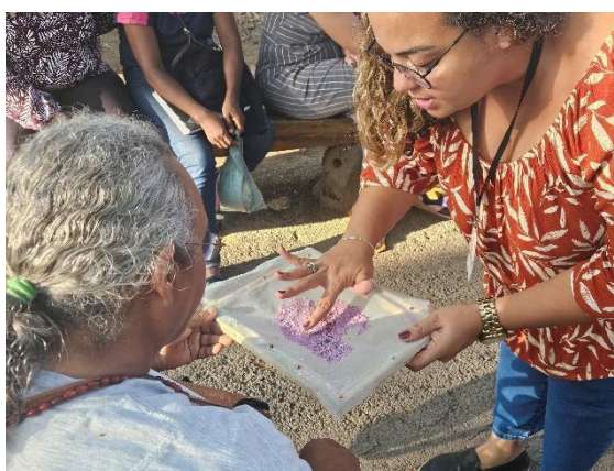
Oficina de papel semente e frutos do cerrado. Autoria: Carolina Rodrigues Data: 25/06/2024