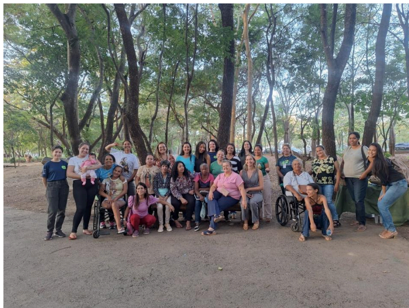
Equipes técnicas (Semente, SEMMA e Casa de Acolhimento Rosa Mística) e acolhidas do projeto. Data: 25/06/2024

O projeto está no primeiro mês do cronograma e apresenta doze meses, no total, de execução. Para esse mês, estavam previstas as atividades de reuniões com parceiros para escolhas dos jardins, verificação in loco dos espaços escolhidos e a aplicação das oficinas de resiliência e ascendência. Por meio da reunião realizada na visita, foi possível atestar que as atividades estão sendo executadas conforme previsto. Além disso, foi acompanhada uma das rodas de conversa presentes no cronograma, previstas para serem realizadas em parques do município.