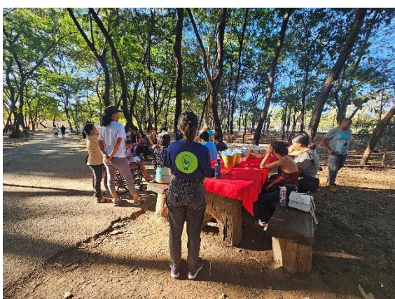
Oficina de papel semente e frutos do cerrado. Autoria: Carolina Rodrigues Data: 25/06/2024