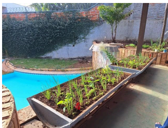
Horta cuidada pelas acolhidas. Data: 25/06/2024

Além do diálogo sobre as oficinas, a reunião abordou alterações que são necessárias no cronograma do projeto e as estratégias que estão sendo adotadas