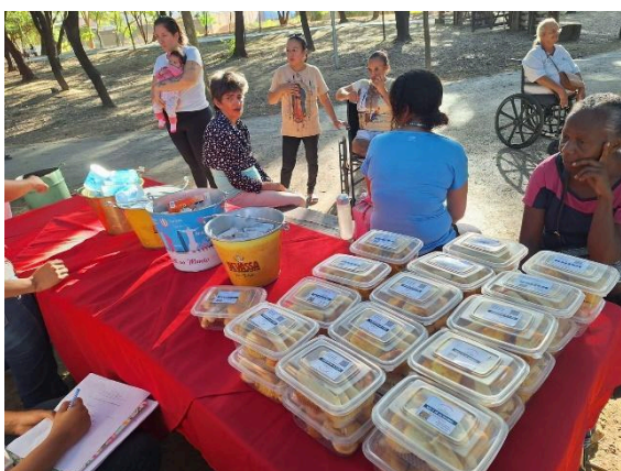
Lanches para a oficina. Data: 25/06/2024