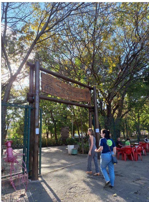
Entrada do Parque Sagarana. Data: 25/06/2024

Após a realização da reunião, as equipes e acolhidas se dirigiram para o Parque Municipal Sagarana, onde estava prevista a realização de uma oficina/roda de conversa pelo projeto. A atividade foi executada em parceria com a Secretaria Municipal do Meio Ambiente de Montes Claros (SEMMA) e contou com o fornecimento de lanche, adquirido pelo projeto.