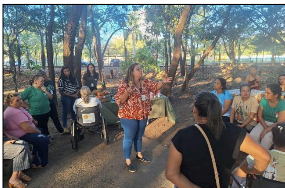
Oficina de papel semente e frutos do cerrado. Data: 25/06/2024

As participantes contribuíram com dúvidas e curiosidades ao longo de toda oficina. Ao final, a equipe da SEMMA solicitou que cada pessoa presente relatasse as suas impressões sobre a atividade e aprendizados adquiridos. Com os relatos realizados, observou-se que a ação foi bem produtiva e recebida por todos.