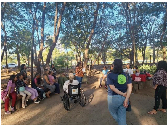
Oficina de papel semente e frutos do cerrado. Data: 25/06/2024