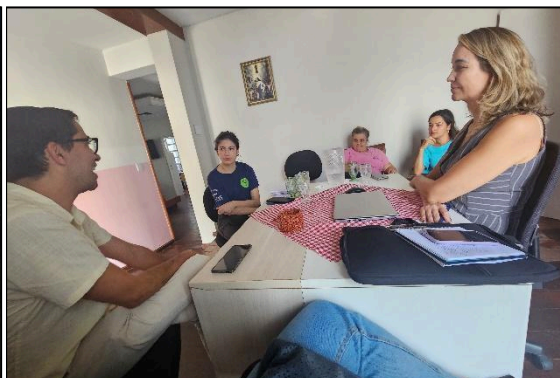
Reunião com a equipe do projeto. Autoria: Carolina Rodrigues Data: 25/06/2024

Na reunião, foram apresentadas as ações iniciais executadas no âmbito do projeto. Todas as acolhidas da Casa estão participando das oficinas iniciais, promovidas pela tecnologia social MASDHE (Marco Sequencial de Desenvolvimento Humano e Empreendedor). Atualmente, estão sendo abordadas temáticas voltadas para o autoconhecimento nas oficinas de ascendência/ponto zero e elaboração dos planos de metas pessoais.