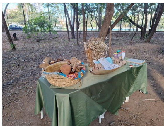
Insumos para a oficina. Data: 25/06/2024

A oficina foi ministrada por cinco analistas da SEMMA, do setor de educação ambiental. As temáticas abordadas foram sobre a confecção de papel semente e apresentação sobre os frutos do cerrado, com ambas sendo enfocadas nas alternativas quanto à confecção de produtos de artesanato para uso pessoal e/ou venda, além de promoverem a sustentabilidade. Ressaltou-se a importância do empoderamento das mulheres presentes nesse processo, ao atuarem com novas possibilidades para geração de renda.