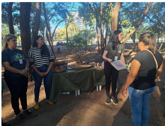
Oficina de papel semente e frutos do cerrado. Autoria: Luísa Mosqueira Data: 25/06/2024