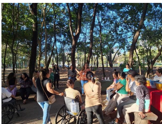
Oficina de papel semente e frutos do cerrado. Data: 25/06/2024