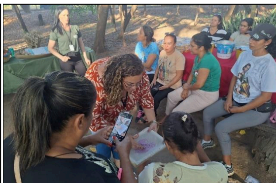
Oficina de papel semente e frutos do cerrado. Data: 25/06/2024