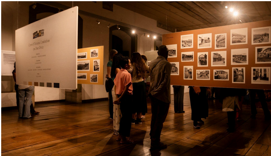
Visitantes na exposição Data: 12/11/2024