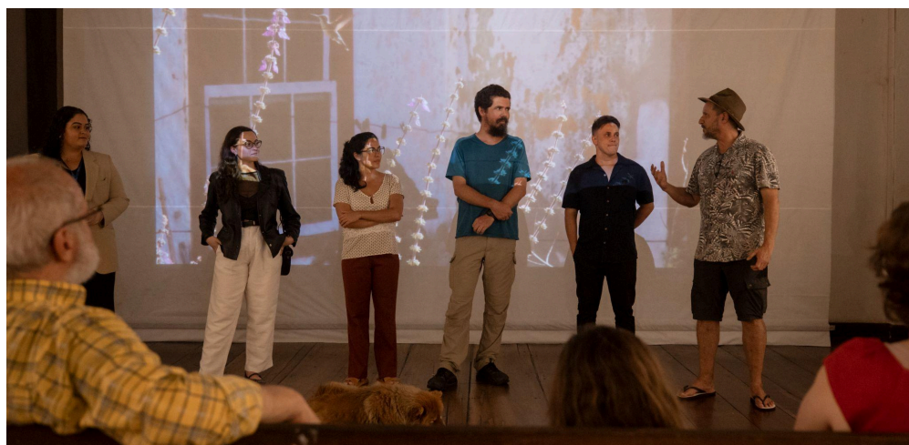
Apresentação das instituições envolvidas nos projetos Data: 12/11/2024