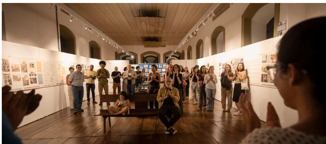
Apresentação dos projetos Autoria: Lucas Godoy Data: 12/11/2024