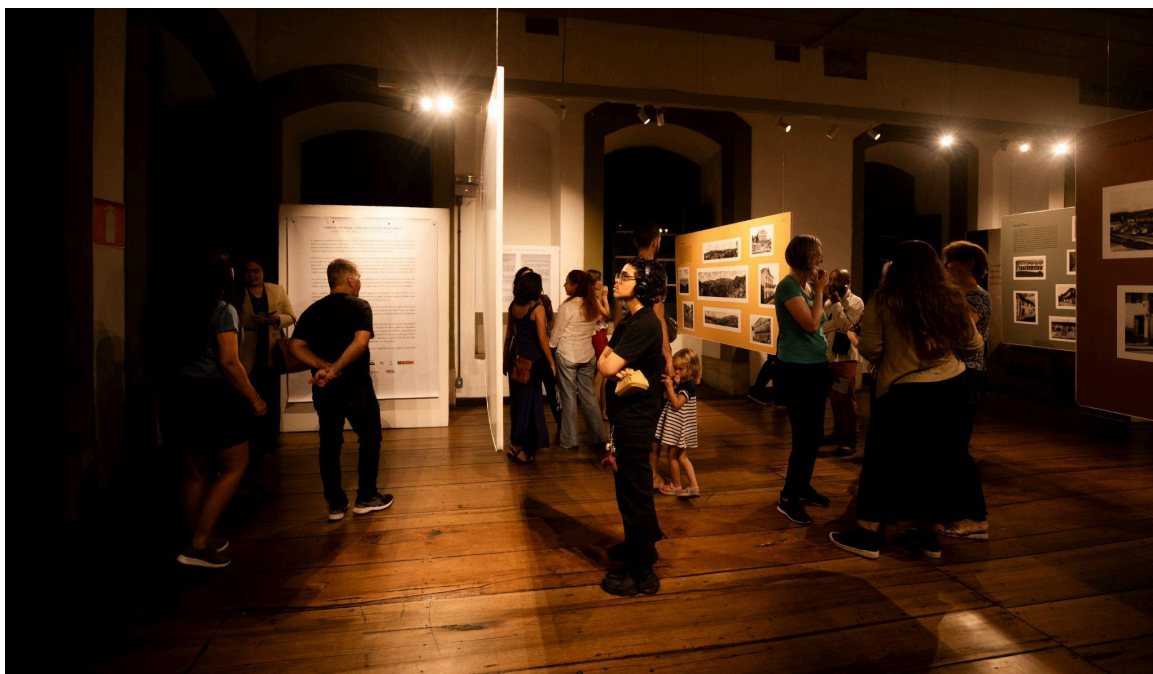
Visitantes na exposição Data: 12/11/2024