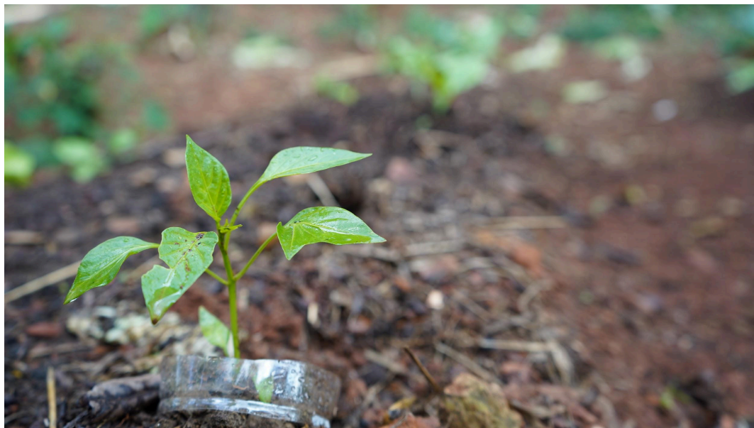
Figura 3 - Mudas plantadas na horta Data: 10/06/2025