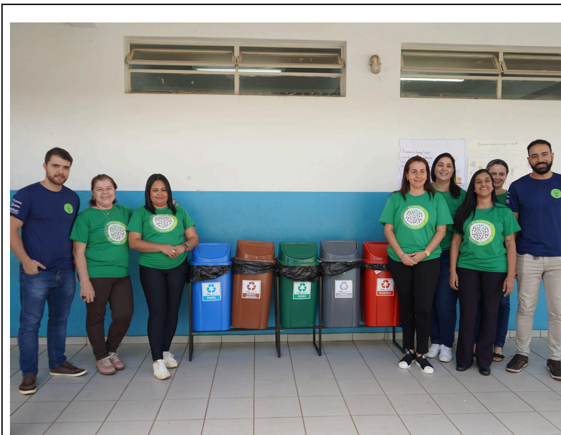
Figura 1 - Equipe Semente e Equipe técnica ONG Juventude Viração