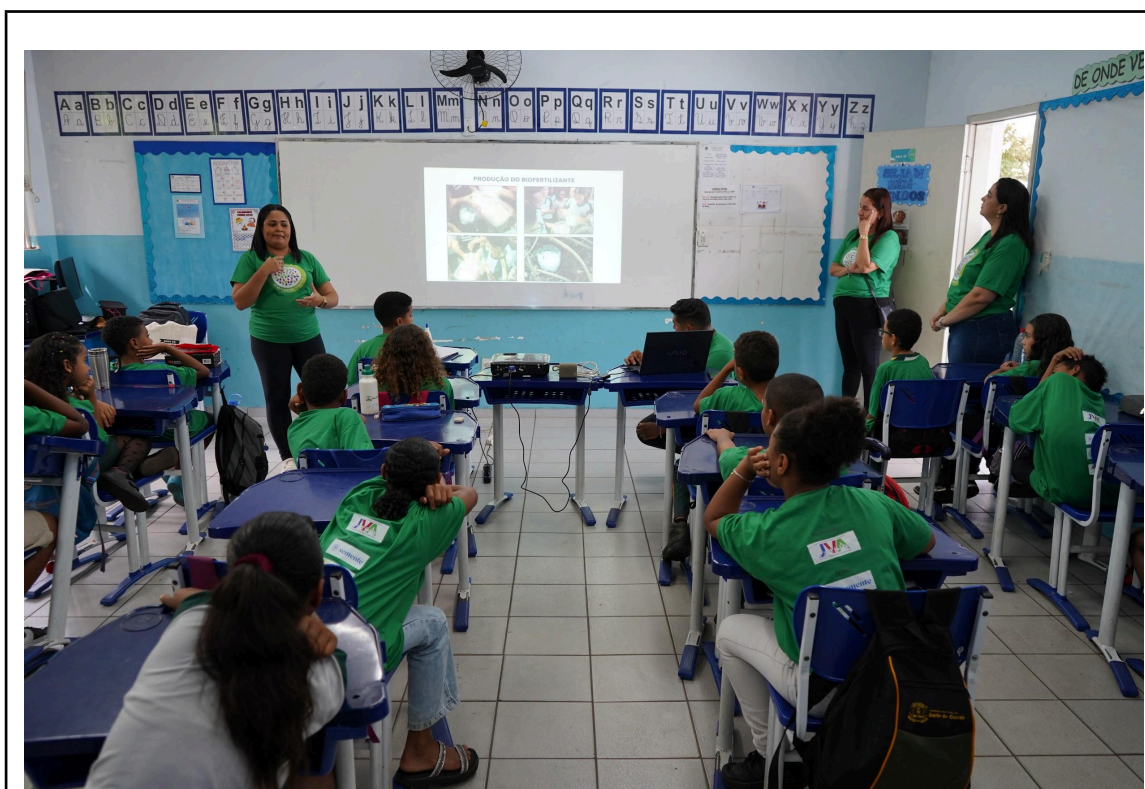
Figura 4 - Equipe ONG Juventude Viração e os alunos participantes do projeto

Durante essas ações, foram distribuídas mudas frutíferas e sementes, promovendo a escuta ativa e o diálogo com os públicos atendidos. Ao final da programação, os alunos participantes foram presenteados com dois kits contendo caderno, caneta, uma garrafa reutilizável e guloseimas, como forma de reconhecimento pelo engajamento demonstrado ao longo do projeto.