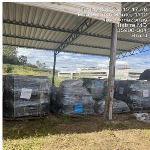
Imagem 7. Conexões e acessórios no canteiro de armazenamento.