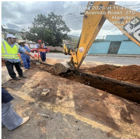
Imagem 3. Escavação para instalação de tubulação.