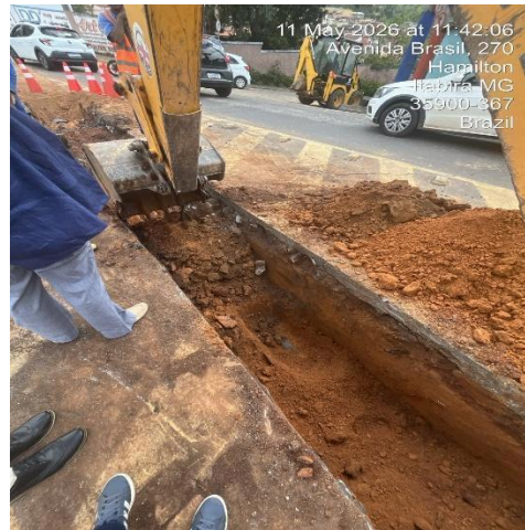
Imagem 4. Escavação para instalação de tubulação.