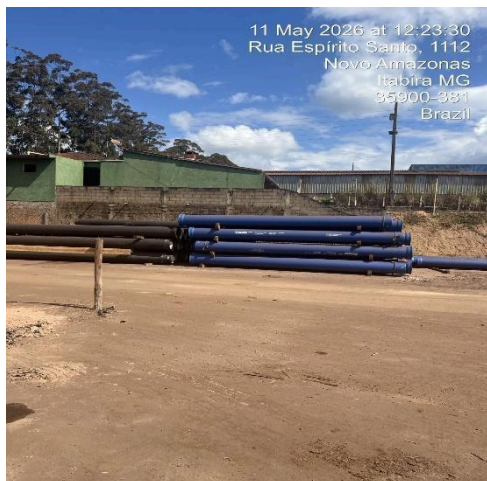
Imagem 6. Tubulação no canteiro de armazenamento.

O último ponto da visita foi no pátio onde estão armazenados os materiais (tubulações, conexões e acessórios) para execução do projeto (imagens 6 e 7), localizado também na Rua Espírito Santo,