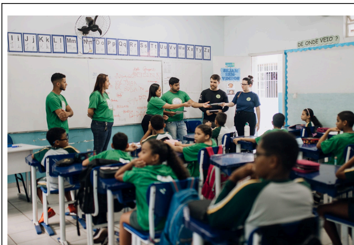
Figura 5 - Equipe ONG Juventude Viração e os alunos participantes do projeto Autoria: Carolina Rodrigues Data: 11/04/2025