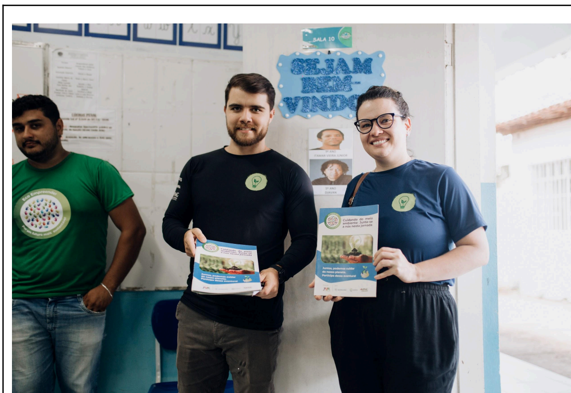
Figura 6 - Cartilha de atividades distribuída aos alunos participantes do projeto