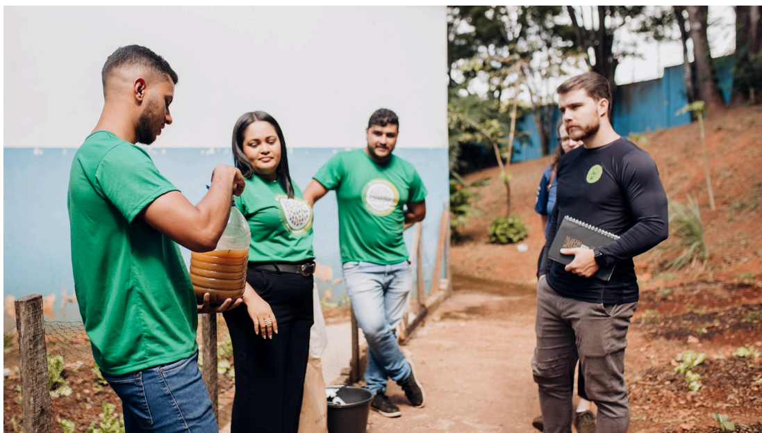
Figura 4 - Equipe ONG Juventude Viração apresentando o biofertilizante produzido na Escola Aracy Novais Data: 11/04/2025