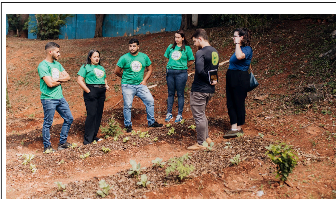
Figura 2 - Equipe ONG Juventude Viração apresentando a horta da Escola Aracy Novais Autoria: Carolina Rodrigues Data: 11/04/2025