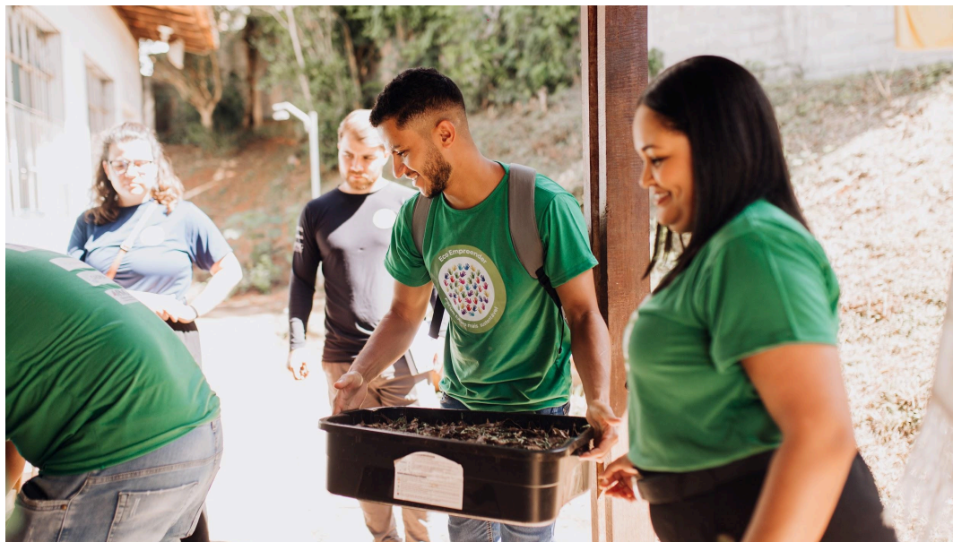
Figura 3 - Equipe ONG Juventude Viração apresentando a composteira da Escola Aracy Novais Data: 11/04/2025