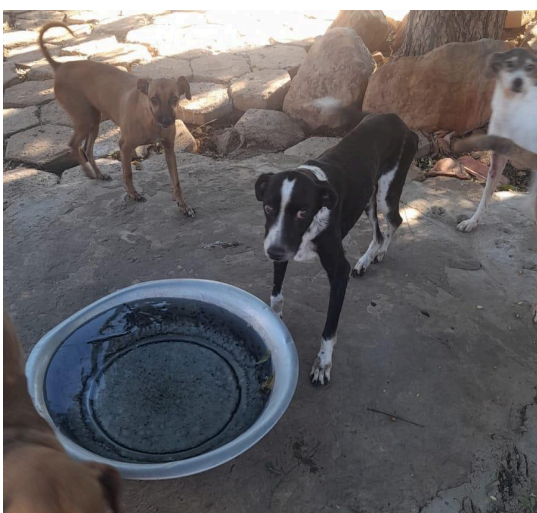
Figura 5: Animal do canil se alimentando