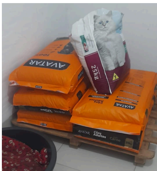
Figura 12: Sacos de ração armazenados na área interna do abrigo

Além das instalações já descritas, também foi apresentada a sala onde a ração fica armazenada. As rações são adquiridas de uma a duas vezes por mês e fornecidas aos animais diariamente, duas vezes ao dia, sendo os recipientes com ração e água repostos sempre que necessário. Durante a visita observou-se água e ração disponíveis a todo momento. Vale destacar que há uma rotatividade dos animais abrigados, devido à adoção por meio de campanhas e divulgação pela ARCA. Ainda, todos os abrigados estão disponíveis para adoção responsável, porém alguns já estão no abrigo há muito tempo por serem animais mutilados, idosos ou sequelados e, portanto, de adoção improvável.