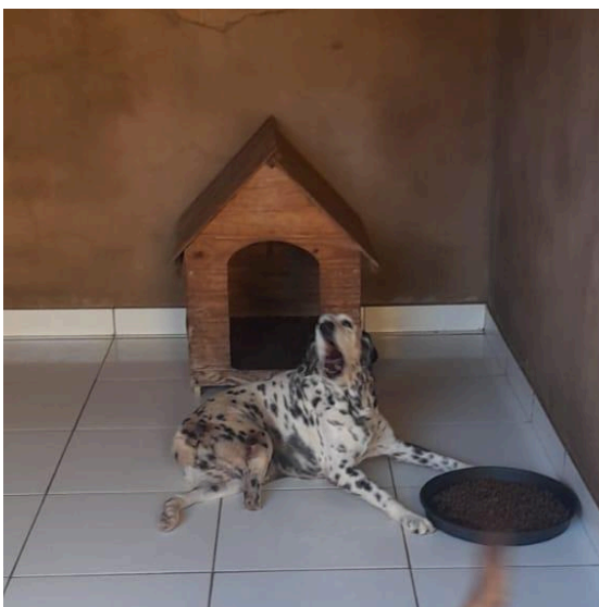
Figura 7: Animal do canil se alimentando