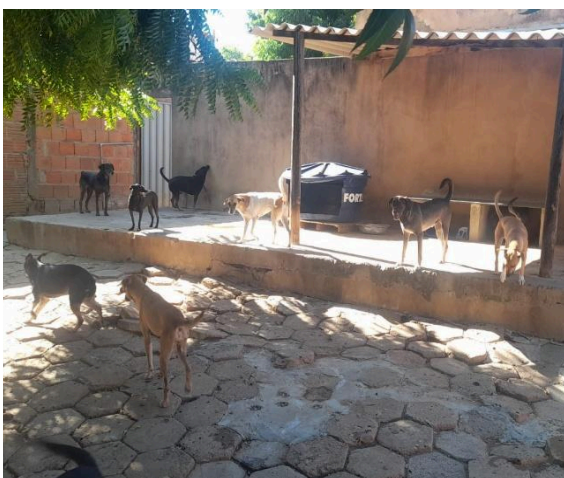
Figura 3: Animais no canil Autoria: Miliane Neto Data: 29/04/2026

Posteriormente a equipe deslocou-se para o abrigo da ARCA, onde atualmente são amparados aproximadamente 102 animais, sendo aproximadamente 100 cães e 02 gatos. O local conta com oito canis e quatro áreas abertas para convívio dos animais, sendo que eles ficam separados por afinidade e por faixa etária. Ainda, os cães que estão se recuperando de alguma cirurgia ou questão de saúde são cuidados na área interna da casa, sendo agregados aos demais quando estão saudáveis. Além destes, os gatos também são mantidos no interior. A limpeza no local é realizada diariamente, duas vezes ao dia, no início da manhã e final da tarde.