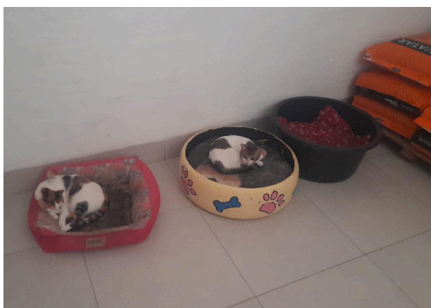
Figura 11: Gatos na área interna do abrigo