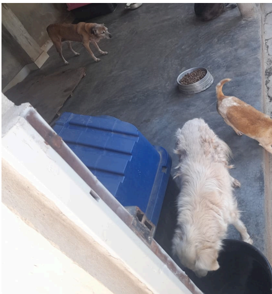
Figura 9: Animal no canil Autoria: Miliane Neto Data: 29/04/2026