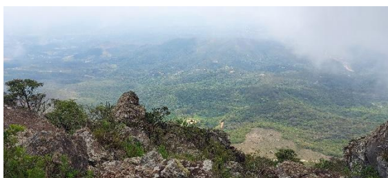
Paisagem da Serra da Piedade Data: 19/10/2023