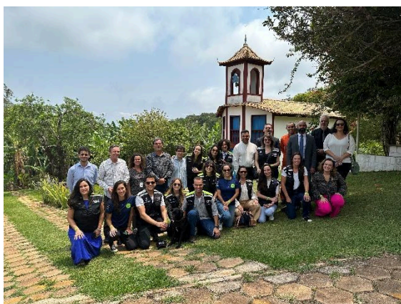
Grupo reunido no início da visita Data: 19/10/2023