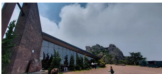
Basílica Estadual das Romarias Data: 19/10/2023