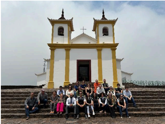
Grupo reunido em frente à Basílica da Piedade Data: 19/10/2023