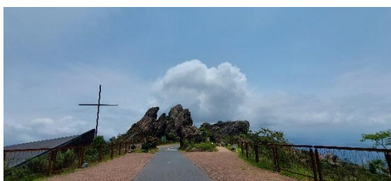
Vista do acesso às Basílicas, restaurante, observatório e via sacra Data: 19/10/2023