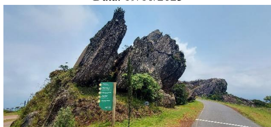
Vista do acesso às Basílicas, restaurante, observatório e via sacra Data: 19/10/2023