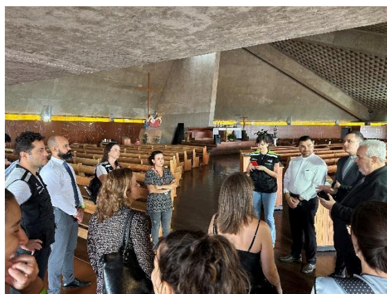
Os padres explicam a situação atual da edificação da Basílica Data: 19/10/2023