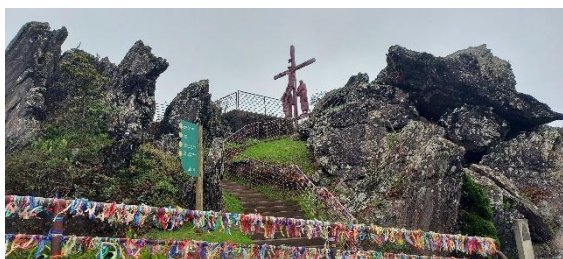
Calvário Autoria: Maria Leticia Tiele Data: 19/10/2023