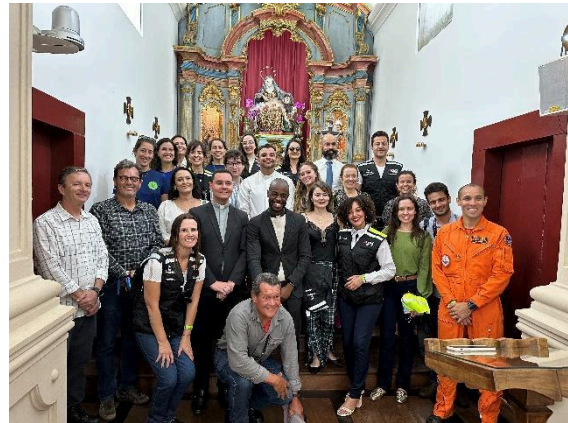
Grupo reunido no altar da Basílica da Piedade Data: 19/10/2023