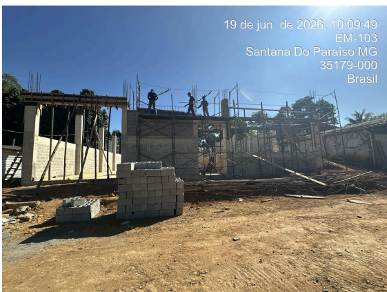
Entrada de caminhões - fachada do galpão Data: 19/06/2026

de Obras Municipal informaram que será executado, por conta própria e sem custeio com o recurso do projeto, o acesso lateral que interliga o galpão com a antiga construção já existente, a qual servirá de depósito do material triado e prensado.