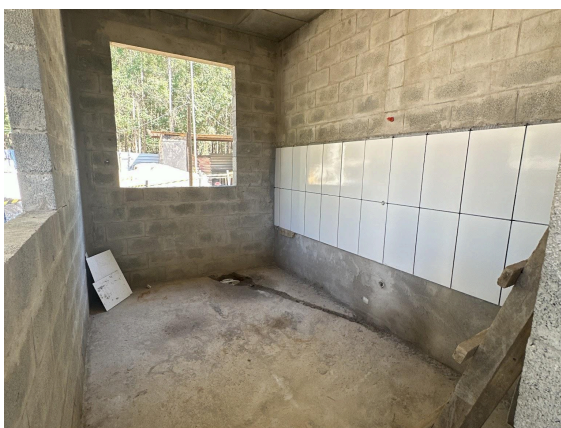
Interno do anexo - Cozinha/ refeitório Data: 19/06/2026