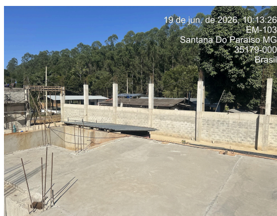
Alvenaria e contenção concluídas Autoria: Thaís Calhau Data: 19/06/2026

No tocante ao anexo, constatou-se que a alvenaria está sendo concluída com a execução final do beiral da cobertura. Além disso, na parte interna do anexo está em andamento a execução do projeto hidráulico, a regularização do contrapiso desempenado e o assentamento de revestimento cerâmico para piso.