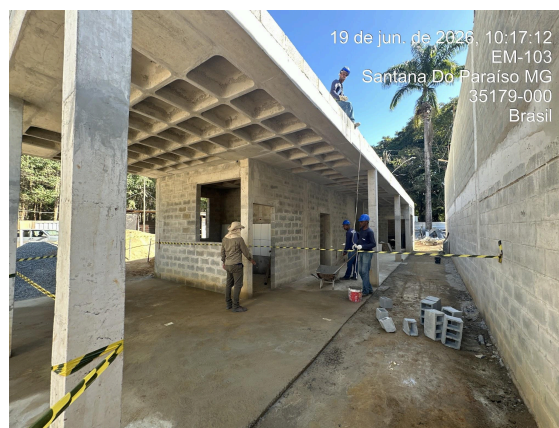
Anexo em fase de conclusão da alvenaria Data: 19/06/2026