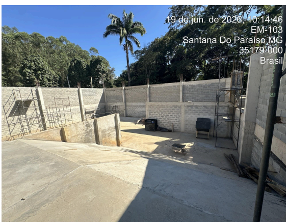
Alvenaria e contenção concluídas Data: 19/06/2026