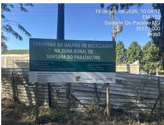
Placa de identificação da obra Data:19/06/2026