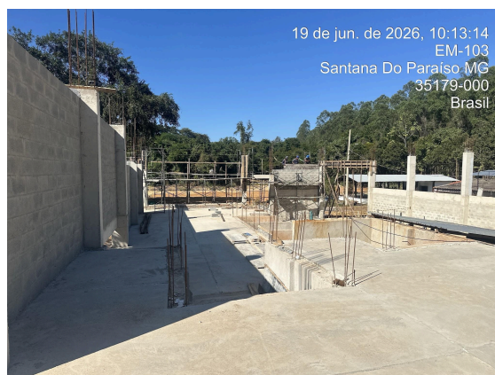
Alvenaria e contenção da passagem de caminhões Data: 19/06/2026