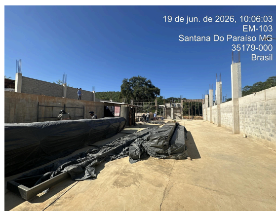
Alvenaria concluída (galpão) Data: 19/06/2026