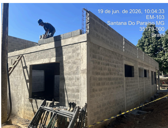
lateral e fundos do anexo - conclusão de alvenaria Autoria: Thaís Calhau Data: 19/06/2026