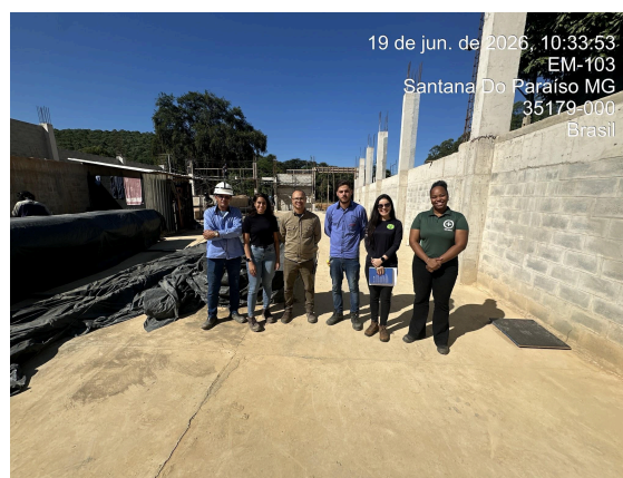
Equipe que orientou a visita Autoria: Thaís Calhau Data: 19/06/2026