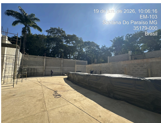
Alvenaria concluída (galpão) Data: 19/06/2026

Atualmente o galpão encontra-se em preparação e montagem do telhado, cuja estrutura metálica está em fabricação, conforme relatado pelos engenheiros responsáveis. Igualmente relataram que as instalações hidráulicas estão em andamento.