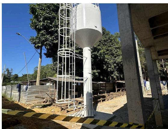
Caixa d'água instalada Data: 19/06/2026

A entrada de caminhões, que se encontra na lateral do galpão, está sendo executada juntamente com a fachada, estando já concluída a alvenaria e contenção da parte lateral do galpão, onde os caminhões transitarão para despejo dos materiais. Os engenheiros da Secretaria