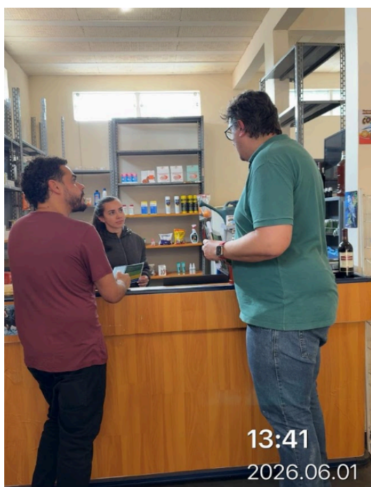
Imagem 3. Equipe proponente passando orientações