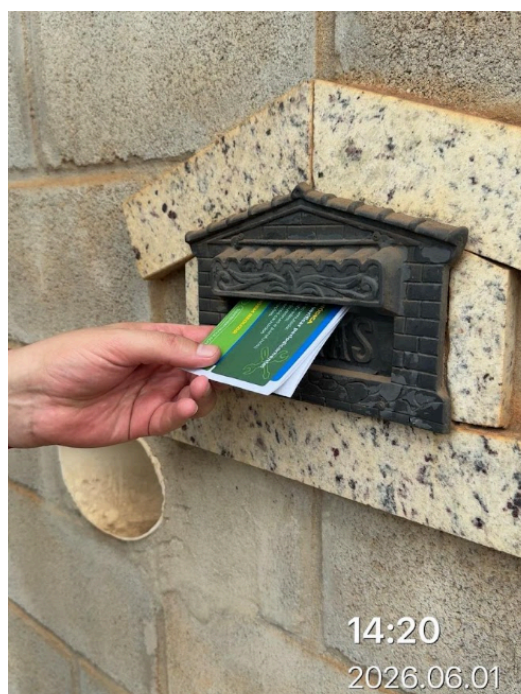
Imagem 4. Entrega do folheto informativo em caixa de correio