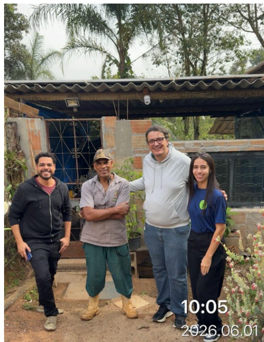
Imagem 6. Equipe proponente e equipe Semente com beneficiário