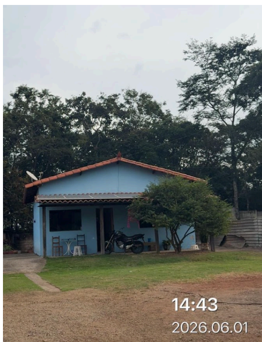
Imagem 1. Visita nas residências com placas instaladas