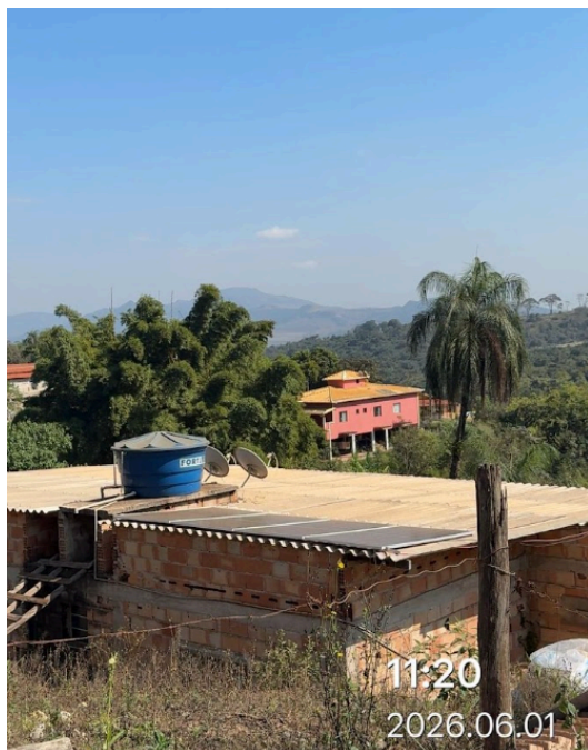
Imagem 5. Sistema fotovoltaico instalado – placas