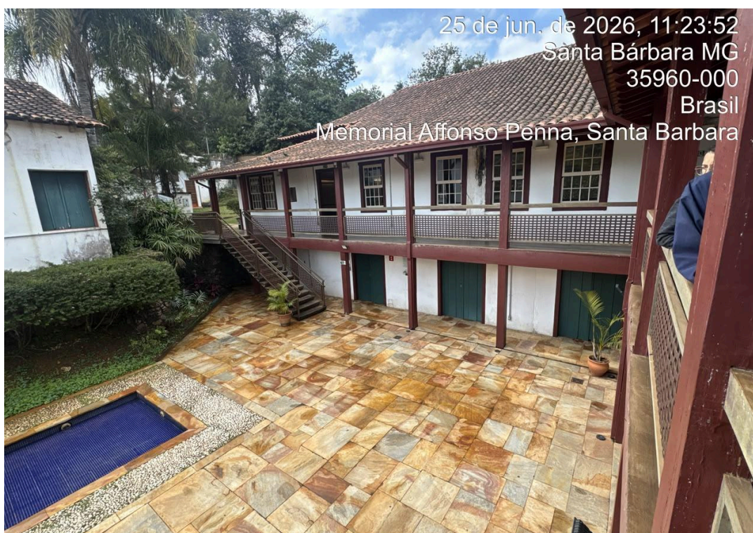
Pátio interno do Memorial Affonso Penna, em Santa Bárbara/MG. Data: 25/06/2026