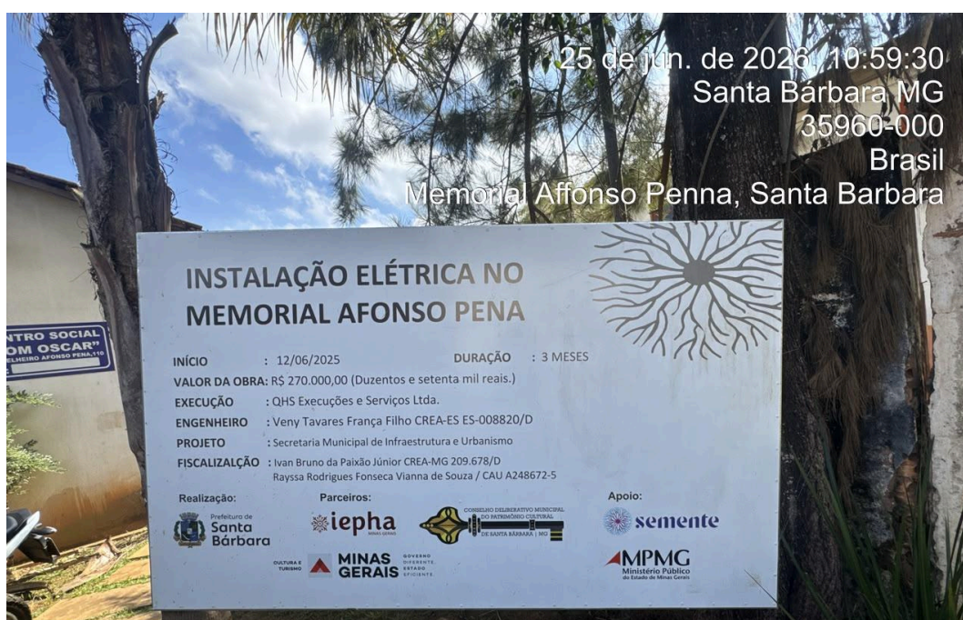
Placa da Obra Autoria: Francielle Ferreira Data: 25/06/2026

Dessa forma, o projeto contempla a revisão completa das instalações elétricas, a modernização do sistema de iluminação com tecnologia LED, mais eficiente e sustentável, e a implantação do Sistema de Proteção e Combate a Incêndio e Pânico, assegurando a conformidade técnica da edificação e proporcionando maior segurança para visitantes, funcionários, pesquisadores, estudantes e demais usuários do espaço.