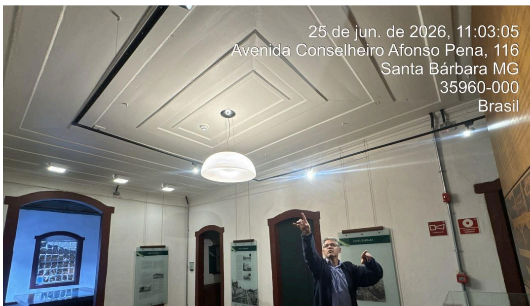
Sistemas elétricos, luminotécnicos e de combate a incêndio instalados na edificação Autoria: Francielle Ferreira Data: 25/06/2026