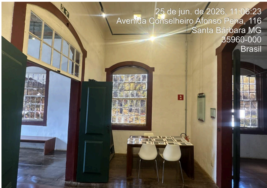
Sistemas elétricos, luminotécnicos e de combate a incêndio instalados na edificação Autoria: Francielle Ferreira Data: 25/06/2026