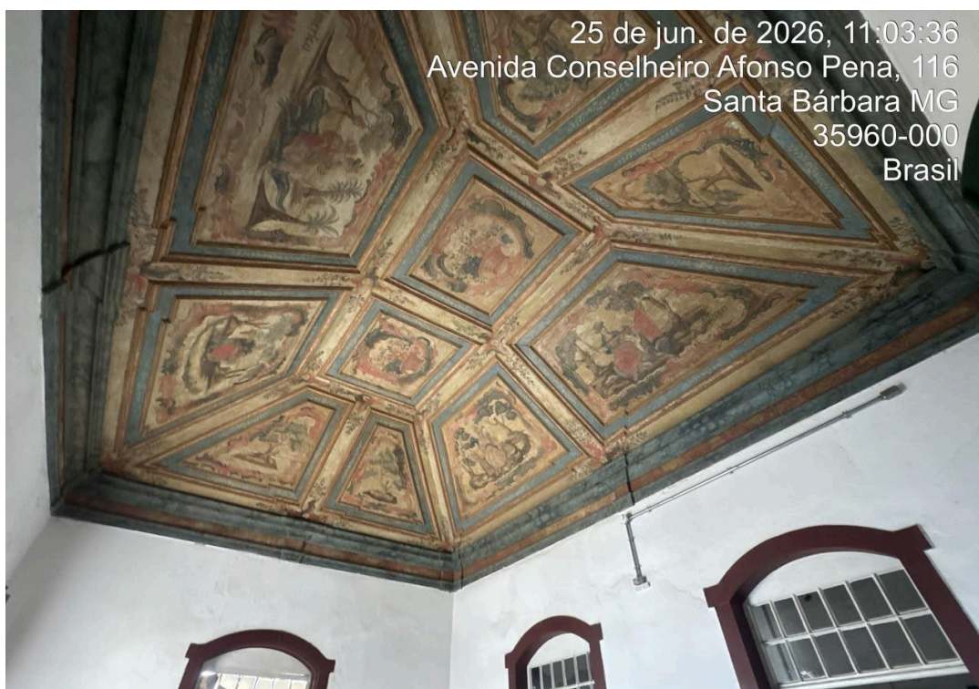
Adaptações no projeto foram realizadas para sanar conflitos com os elementos artísticos Autoria: Francielle Ferreira Data: 25/06/2026