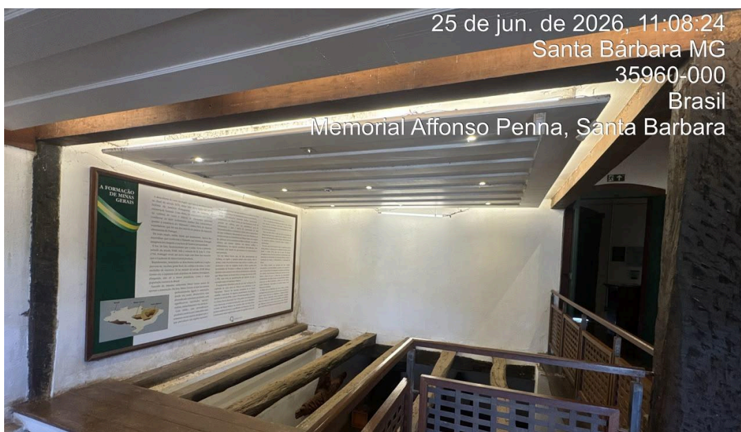
Sistemas elétricos, luminotécnicos e de combate a incêndio instalados na edificação Autoria: Francielle Ferreira Data: 25/06/2026