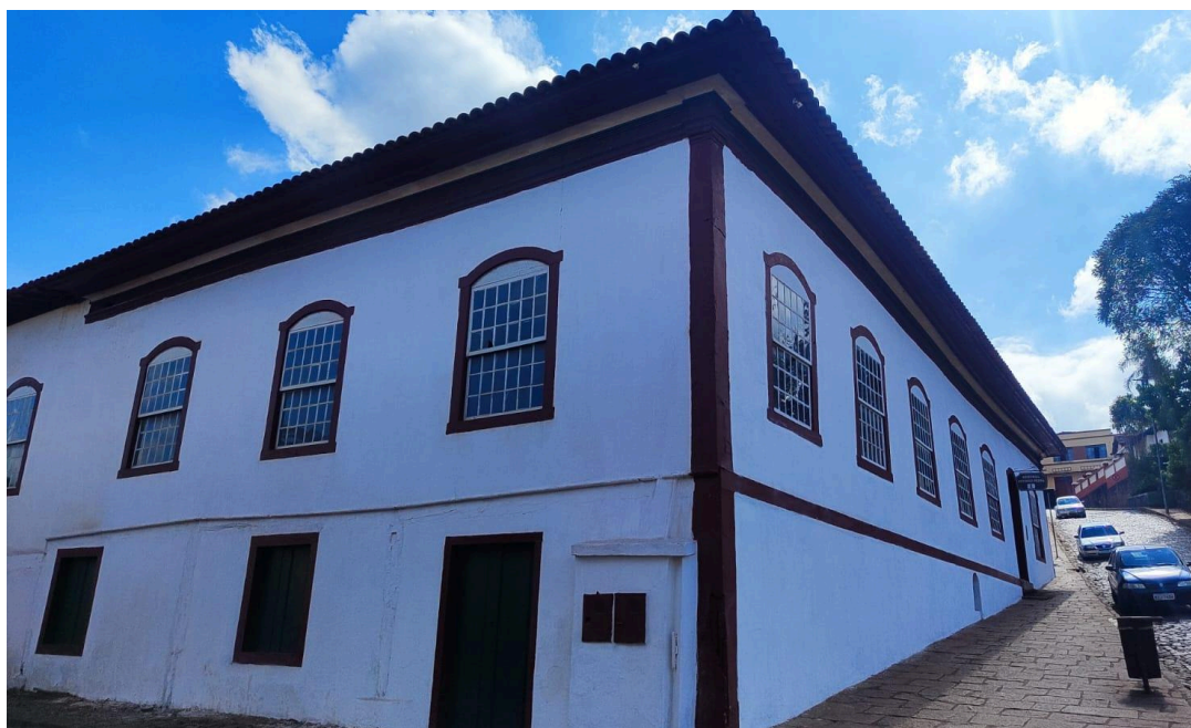
Memorial Affonso Penna, em Santa Bárbara/MG.